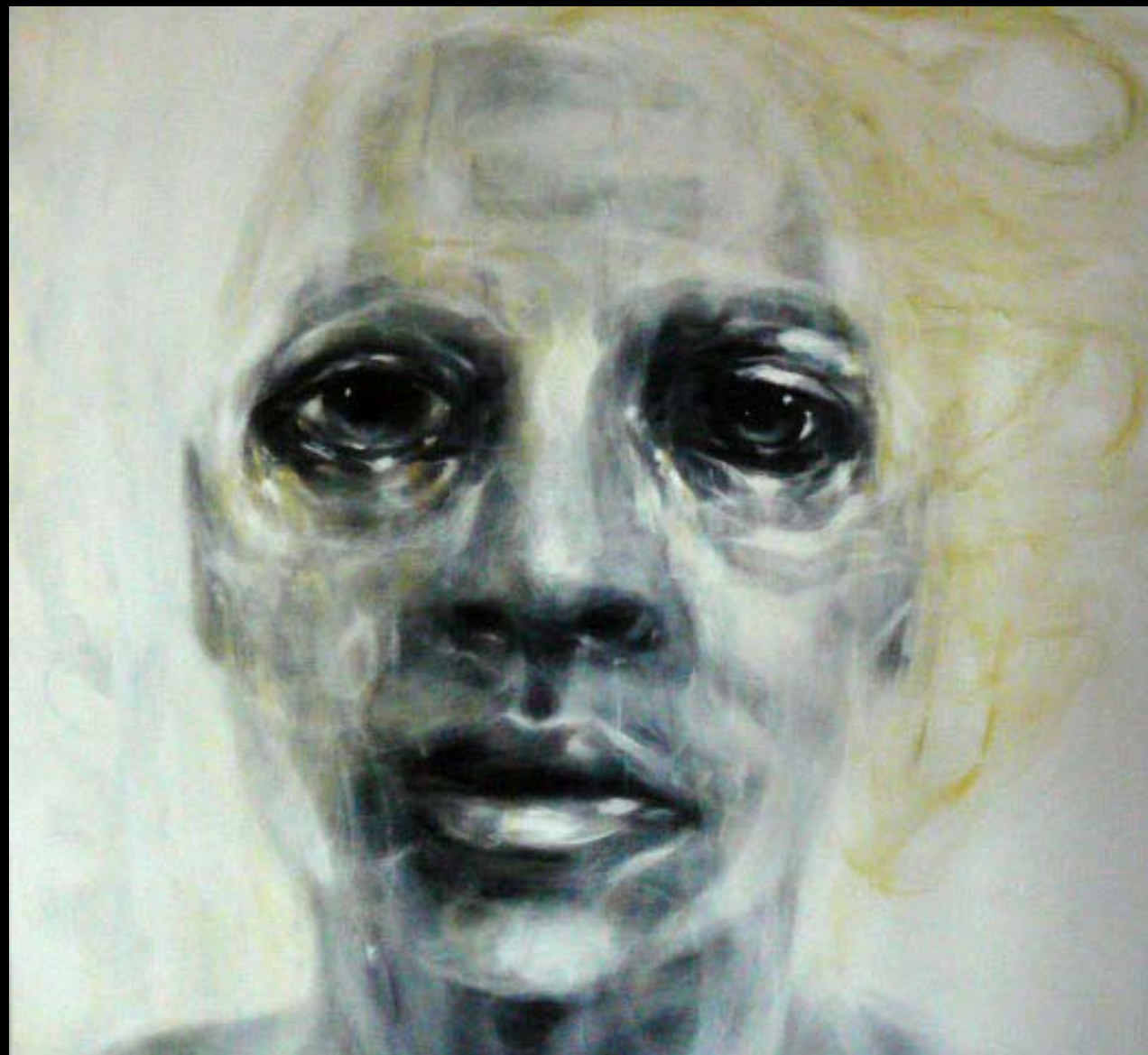
MIGRATOR • ACRYLIQUE SUR TOILE • 150 x 150 cm