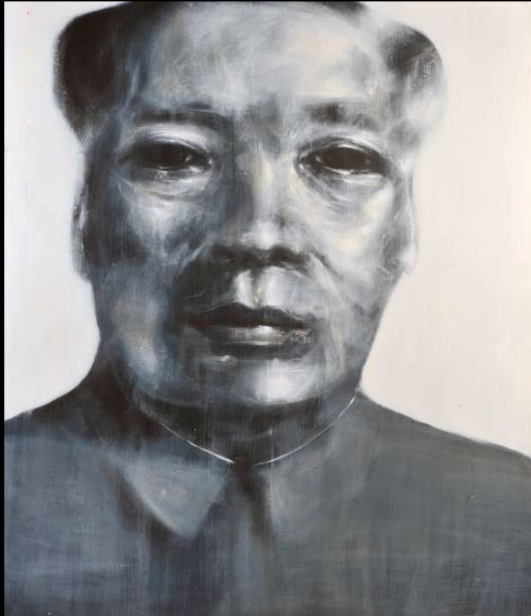
I AM NOT SO BAD • ACRYLIQUE SUR TOILE • 190 x 160 cm