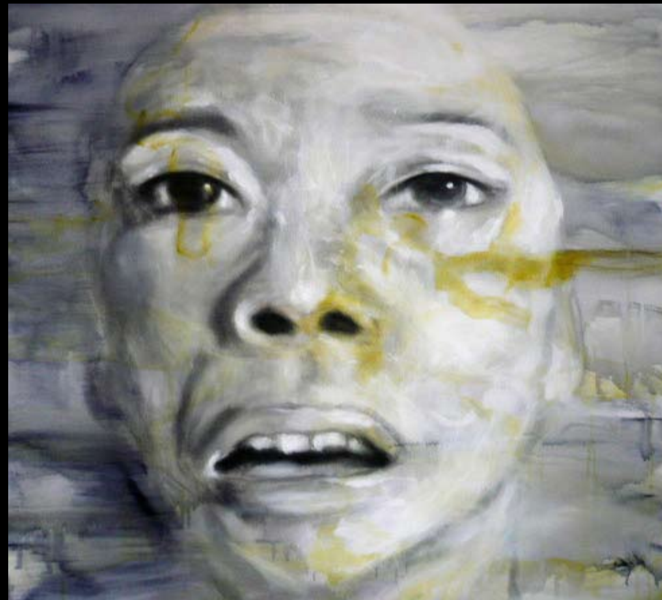
MIGRATOR 3 • ACRYLIQUE SUR TOILE • 100 x 100 cm