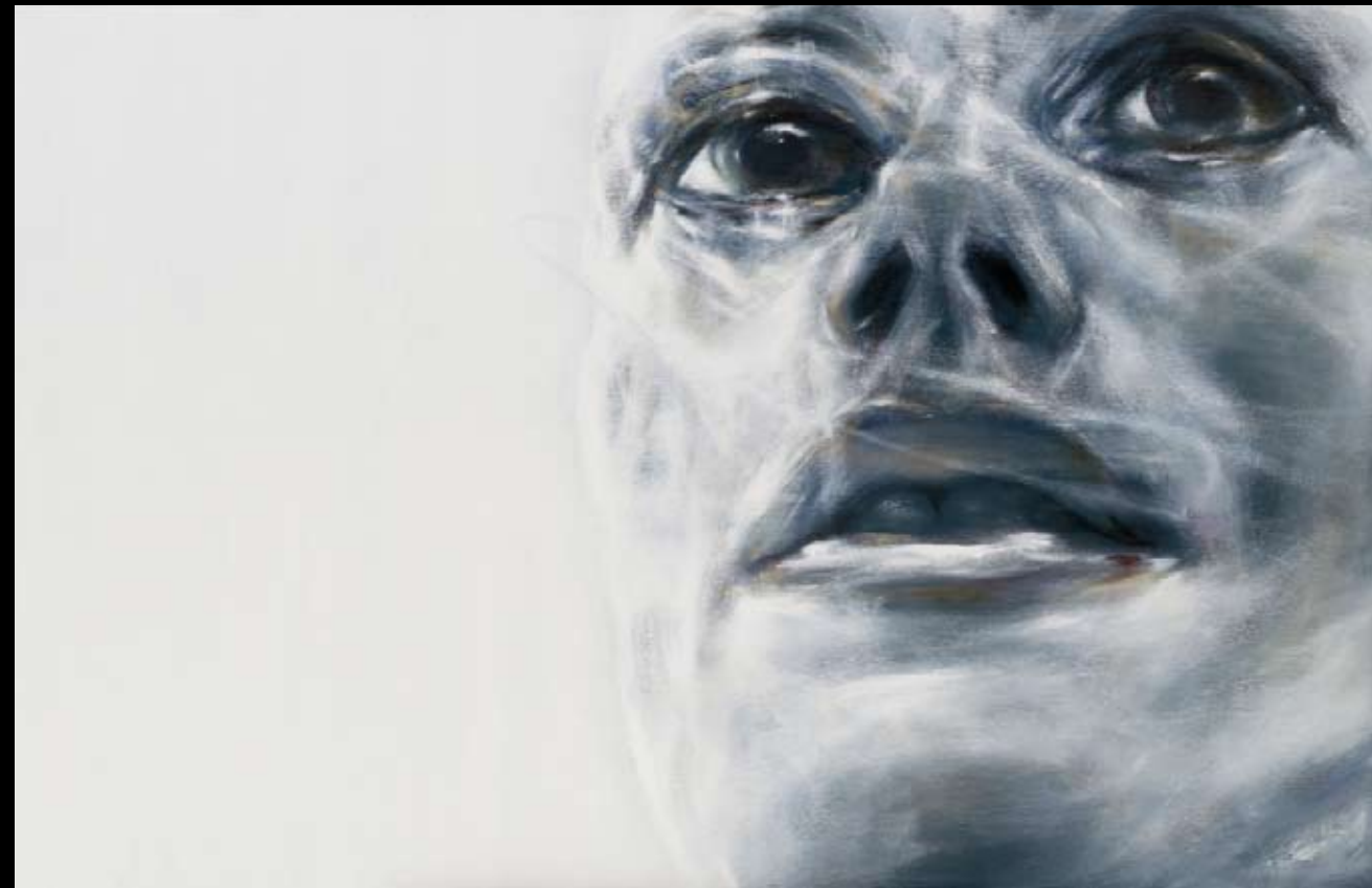
UPPER MOUNTAIN • ACRYLIQUE SUR TOILE • 100 x 150 cm