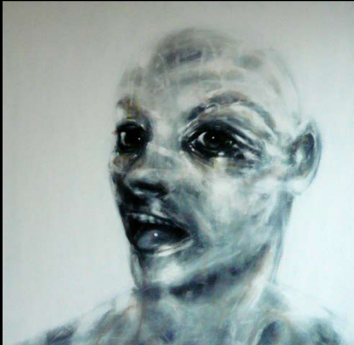
LOWER CURATOR • ACRYLIQUE SUR TOILE • 150 x 150 cm